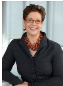
Staatssekretärin im Bundesministerium für Wirtschaft, Familie und Jugend