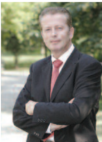
Bundesminister für Wirtschaft, Familie und Jugend

Um den Opfern größtmöglichen Schutz zu bieten, ist es uns ein großes Anliegen, dass die Zusammenarbeit aller mit der Gewalt in der Familie befassten Einrichtungen verstärkt wird. Denn Kinder haben ein Recht darauf, ohne Gewalt aufwachsen zu können und bei Gewalterfahrungen von der Gesellschaft aufgefangen und betreut zu werden. Darüber hinaus soll diese Broschüre ein deutliches Zeichen dafür setzen, dass Gewalt auch dann nicht toleriert oder bagatellisiert werden darf, wenn sie im engsten Familienkreis stattfindet.